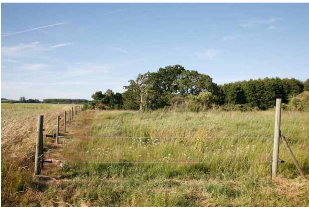
Några partier med torrängsvegetation finns.