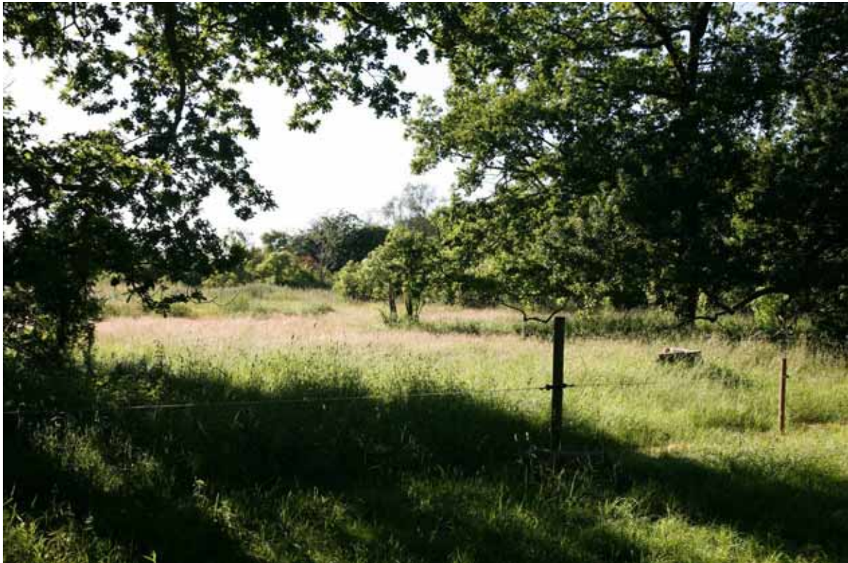
Betesmark vid Tågerup