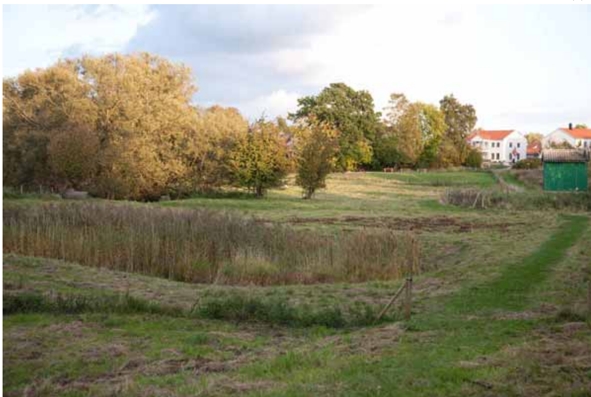
Dösjebro byalag håller stigar i ordning i och utanför stängslet.