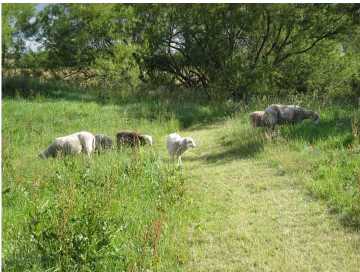
I området finns även ett litet fårhus.