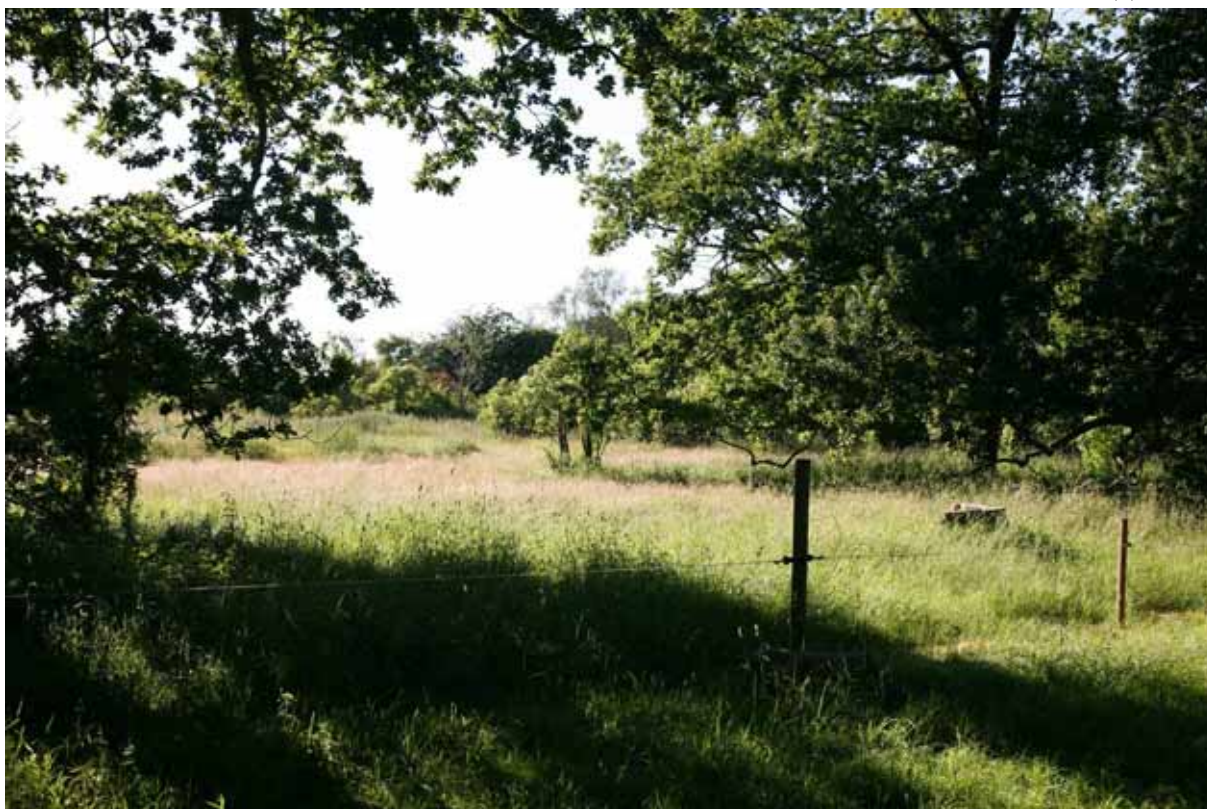
Området är även rikt på buskar av nypon och fläder.