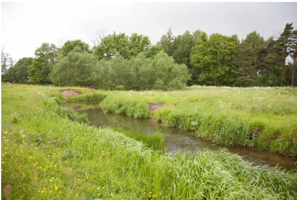
Vid ån finns även några öppna partier.