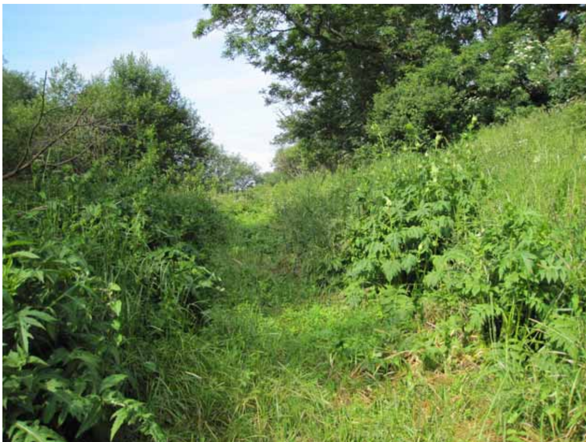
Delar av området är kraftigt igenväxt men några stigar har öppnats upp för att leda in kreaturen.