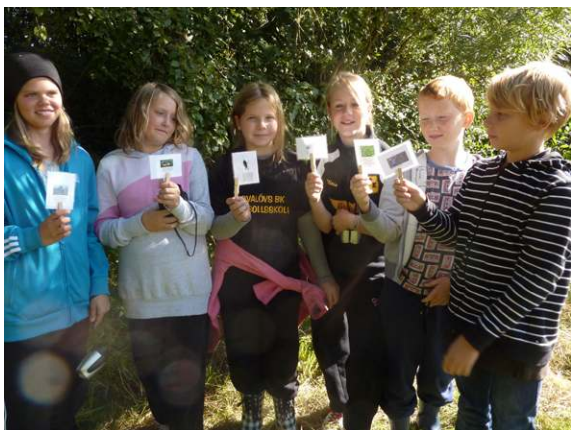
Häljarp. Eleverna har bildat en näringskedja av djur och växter som man vanligtvis kan hitta vid och i vatten.