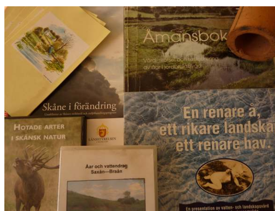
Material på temat visas upp: broschyrer om besöksvärda naturområden längs ån, Åmansboken, video.