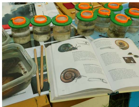
Eleverna använder luppur och bestämningmaterial och vi pratar tillsammans om vad vi hittat.