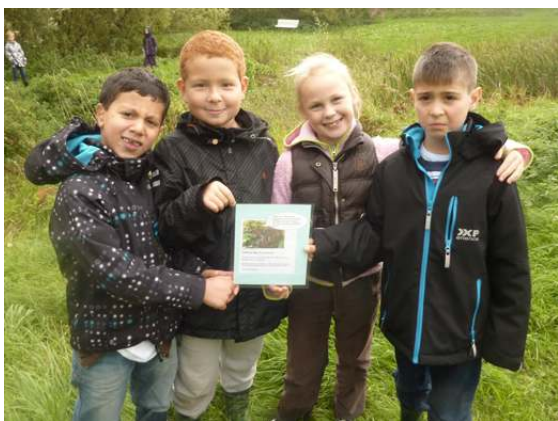
Vi letar efter boplatser för fladdermöss och grodor här vid ån! Korten beskriver vad djuren behöver.