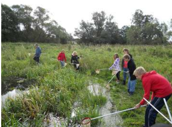
Vattenscorpioner, trollsländelarver, posthornssnäckor, hästigtlar och igelknopp i en damm på betesmark i Dösjebro.