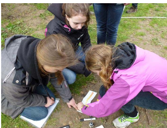
Högstadieklass mäter kvävehalten i dammen och ån. Häljarp.