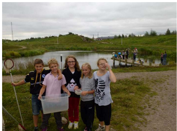
Klass från Teckomatorp besöker Vallarna, ett f d förorenat område som gjorts om till ett natur- och friluftsområde.