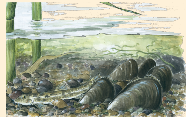
Illustration: Maria Nilsson, www.ritverk.se

Saxån är ett nationellt särskilt värdefullt vattendrag p g a sitt meandrande förlopp och som viktig vandringsled för havsöring. I ån finns dessutom t ex grönling och sandkrypare men också den hotade arten tjockskalig målarmussla.