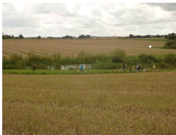
Damm som tar emot dräneringsvatten från åkermark. Marieholm. Håvning och tipsrunda om vattenvård.