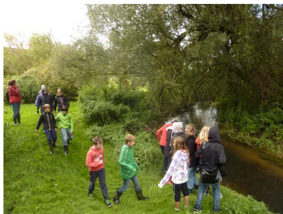
Dösjebro. Elever går ner i den gamla rätade å-färan och ser hur återmeandringen förändrat ån.