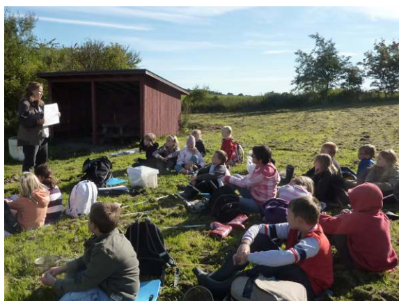
Besökarna tar del av en berättelse om hur utdikningen gick till och vilka följderna blivit. Marieholm.

Syftet med informationstureerna är att berätta om hur människan förändrat landskapet under de senaste århundradena, vad detta fått för följder för vattenkvalitet, landskapets vattenhållande förmåga och biologisk mångfald och hur Saxån-Braåns Vattenråd arbetar med dessa frågor längs ån. Förhoppningen är att detta i förlängningen kan ge ökat engagemang hos allmänheten och underlätta vid framtida vattenvårdande åtgärder. Turerna går i linje med Länsstyrelsens riktlinjer att resurser behöver avsättas för information som ger ökad insikt och engagemang i samhället om varför olika vattenvårdande åtgärder behövs.