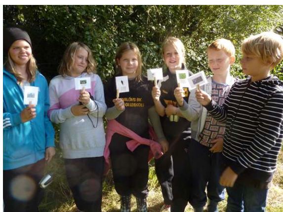
Häljarp. Eleverna har bildat en näringskedja av djur och växter som man vanligtvis kan hitta vid och i vatten.

Besökarnas åldersfördelning på turerna 2010-2015. Totalt 2001 besökare.